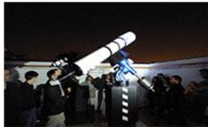
INAF - MONTECOMPATRI