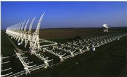
CROCE DEL NORD - MEDICINA