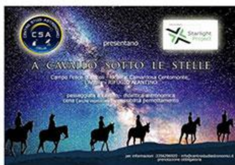
PASSEGGIATE A CAVALLO