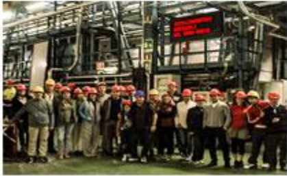
LABORATORI GRAN SASSO