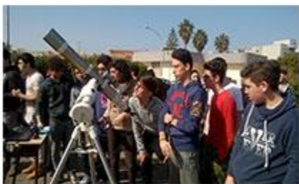
UNIVERSITA' TOR VERGATA