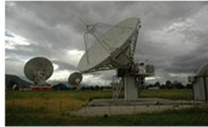
CENTRO SPAZIALE FUCINO